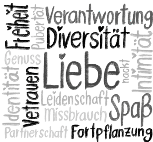
Abb. 1: Word Cloud zum Begriff Sexualität (WiSe 20/21)

Nach dem persönlichen Wortwolken-Einstieg legt sich – insbesondere bei einem multikulturellen Teilnehmendenkreis – eine gemeinsame Textbasis zur Einführung in das Thema nahe. In idealer Weise eignet sich dazu das nach den Familiensynoden der Jahre 2014 und 2015 veröffentlichte Lehrschreiben Amoris laetitia (Papst Franziskus 2016; Abk.: AL), in dem ein bislang eher wenig beachtetes Kapitel