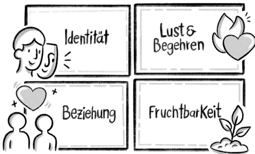
Abb. 3: Vier Aspekte der Sexualität

Aus sexualpädagogischer Sicht kommt man spätestens an dieser Stelle an Klarheit hinsichtlich einiger Begriffe der Sexualwissenschaft wie etwa der Sexuellen Identität oder der Geschlechtsidentität nicht vorbei. In meiner Lehrpraxis erarbeite ich die Terminologie mittels einer Online-Präsentation (Dörnemann 2024), die in das Verständnis einführt. »Der Begriff Sexuelle Identität sagt aus, wer wir bezüglich des Geschlechts und des sexuellen Erlebens sind, d. h. wie wir uns selbst sehen und erleben und wie wir von anderen Personen wahrgenommen werden und wahrgenommen werden wollen. Vier Charakteristika prägen Sexuelle Identität: die körperliche Ausprägung (biologisches Geschlecht), die seelische Verfasstheit (psychisches Geschlecht oder Geschlechtsidentität), die gesellschaftliche Rollenzuschreibung (soziales Geschlecht) und das individuelle Begehren (Sexuelle Präferenz)« (Dörnemann/Leimgruber 107; Dörnemann 2025). Die Sexuelle Identität zeigt an, wie sehr Sexualität das Menschsein von Anfang an in einem fortwährenden biopsychosozialen Prozess in individueller Weise prägt und beinahe in jedem Moment des Lebens neu eingeübt wird.